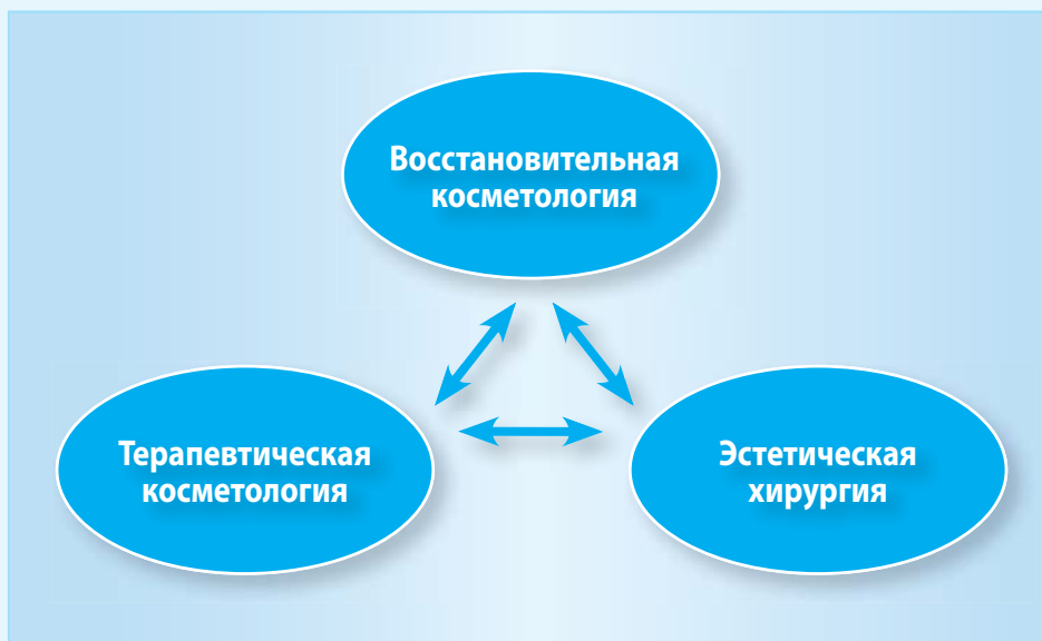
Рис. 1. Направления эстетической медицины