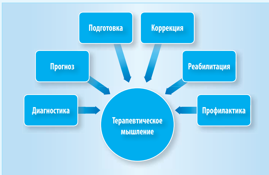
Рис. 3. Суть терапевтического мышления