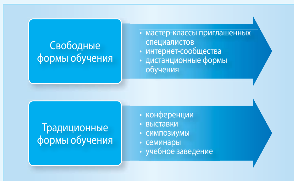
Рис. 2. Различные формы обучения