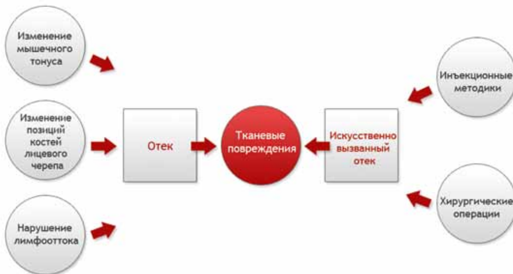
Схема 2. Причина тканевых повреждений

Формирование возрастных изменений лица и шеи представляет собой естественный процесс, имеющий свои причины, этапы и механизмы. С помощью пластической операции действительно можно устранить последствия процесса старения: отсечь лишнее, удалить избытки кожи, максимально зафиксировать кожу на подлежащих тканях, закрепить и укоротить перерастянутые мышцы. Но пластическая хирургия не сможет повлиять на физиологический механизм дальнейших эстетических возрастных изменений лица и шеи, особенно на физиологический механизм гравитационных изменений лица